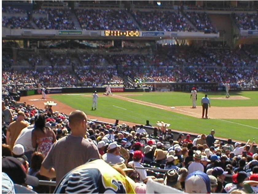
Everth Cabrera en su primer turno al bate el sábado 28/08/2010 en Petco Park.

Aprovecho para comentar que cuatro meses después de ese memorable episodio, caminando cerca del Petco Park observé con inusitado regocijo que dicho monumental estadio se encontraba adornado por un espectacular retrato a gran escala del nicaragüense Everth Cabrera (ver foto adjunta).