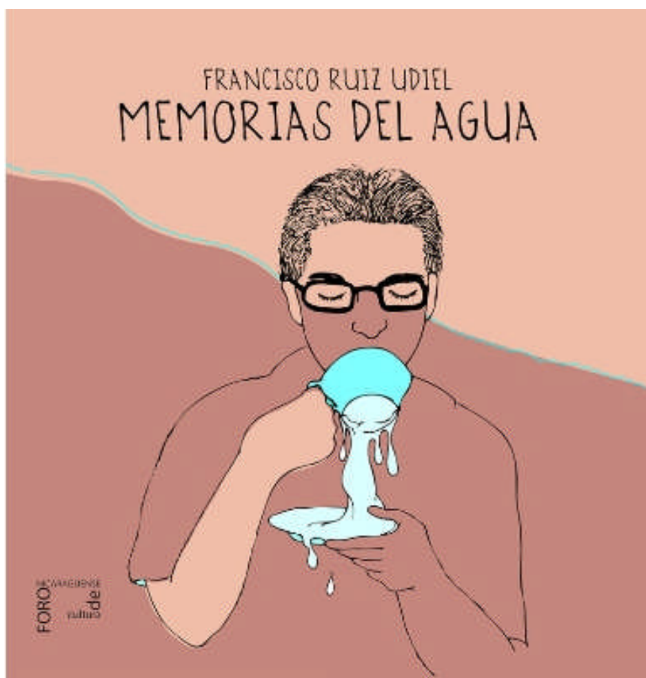
Portada del libro póstumo Memorias del Agua (Managua, 2011) 11 .